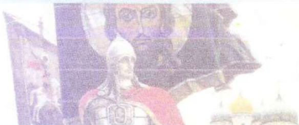
ЭПОХА СВЯТОГО АЛЕКСАНДРА НЕВСКОГО